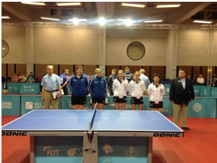
Leikurinn við Lúxemborg

Þriðji leikurinn var við Möltu kl. 17:00 og voru úrslit eftirfarandi: